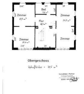
35 Grundriss Wohnfl. DG.jpg