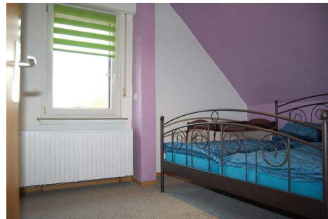
21 Zimmer DG.JPG