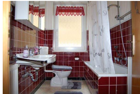
15 Badezimmer EG.JPG