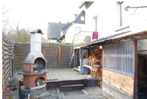
09 Rückseite mit Ausgang Wohnzimmer.JPG