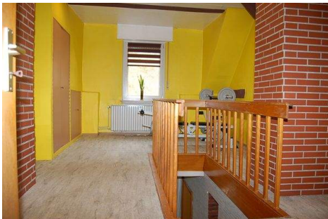
20 Flur DG.JPG