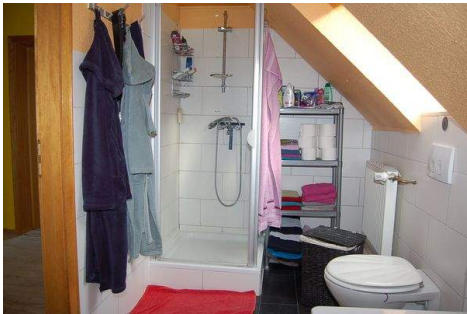
24 Badezimmer DG.JPG