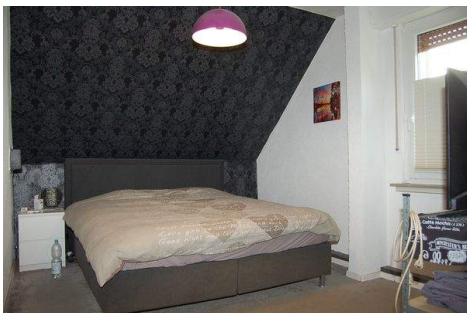
22 Zimmer DG.JPG