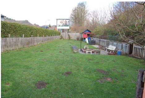
08 grosses Grundstück.JPG