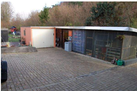
04 Hoffläche mit Garage und Werkstatt.JPG