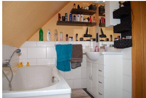
25 Badezimmer DG.JPG