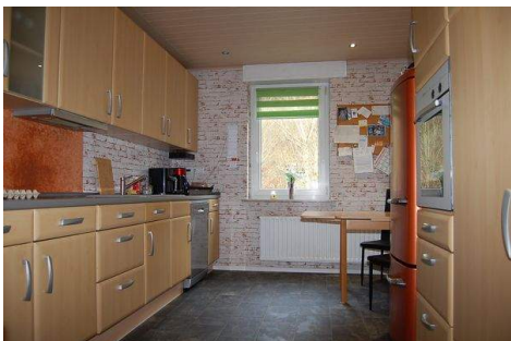
12 Küche mit EBK.JPG