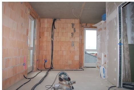
LH 07 OG Zimmer.JPG