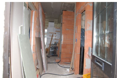
LH 01 EG Eingang Flur.JPG