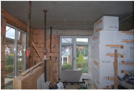
LH 02 EG Wohnzimmer.JPG