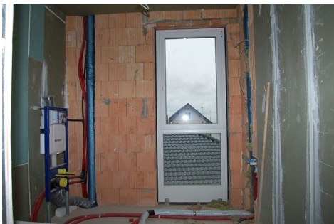
LH 06 OG Badezimmer.JPG