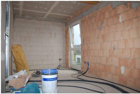
LH 14 DG Zimmer.JPG