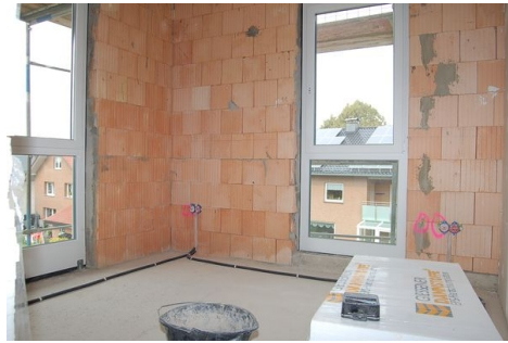
LH 09 OG Zimmer.JPG