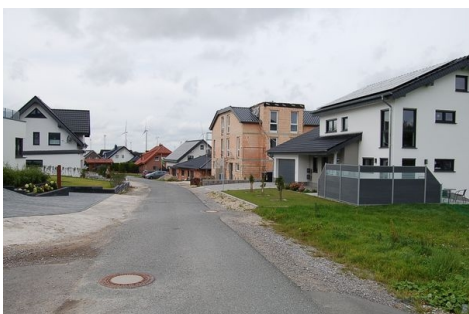
06 ruhige Wohngegend.JPG