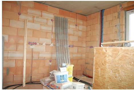
LH 03 Küche.JPG