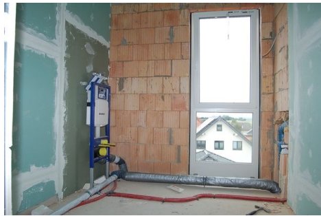
LH 11 DG Badezimmer.JPG