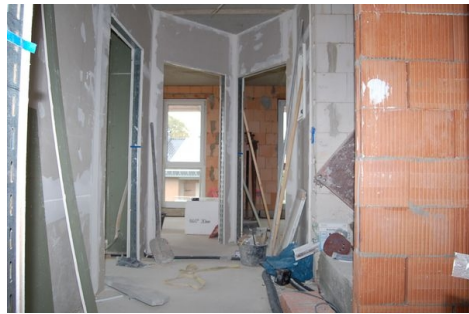
LH 05 OG Flur.JPG