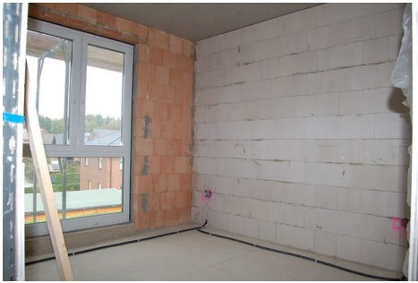
LH 08 OG Zimmer.JPG