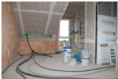
LH 13 DG Zimmer.JPG