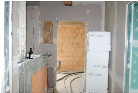
LH 10 DG Flur.JPG