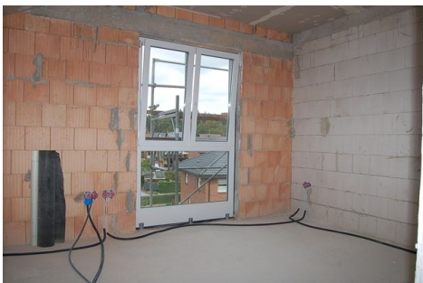
LH 12 DG Zimmer.JPG