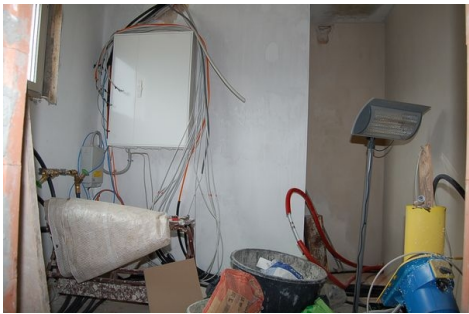
LH 04 HAR Heizung Strom.JPG