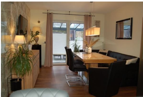
14 Esszimmer Ausgang Garten