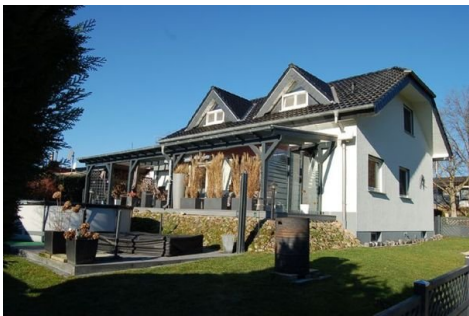
08 Gesamtansicht Garten Terrasse Pool