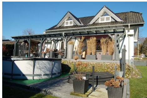
05 überdachte Terrasse mit Pool