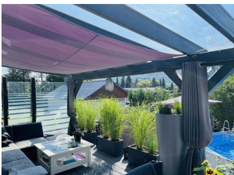
06 überdachte Terrasse