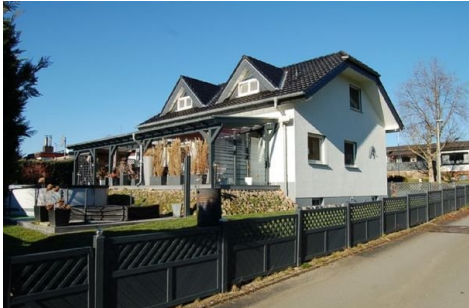
02 Rückseite mit Garten