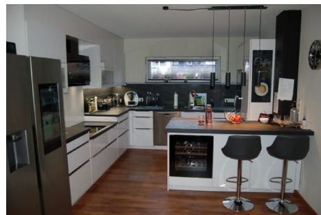
13 neue Küche