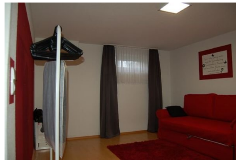
21 Gästezimmer Keller