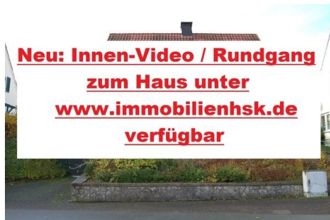
25 Hinweis Video.JPG