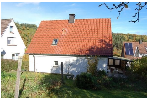
04 sonnige Rückseite.JPG