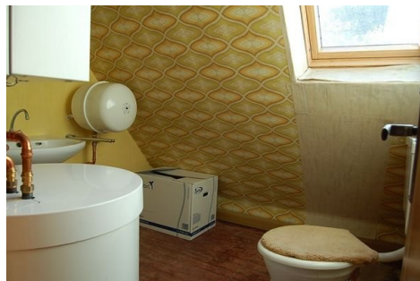
17 WC und Heizung.JPG