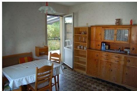
13 Küche mit Ausgang Terrasse.JPG