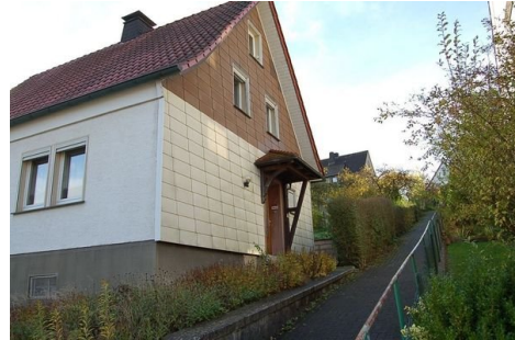
03 Seitenansicht mit Eingang.JPG