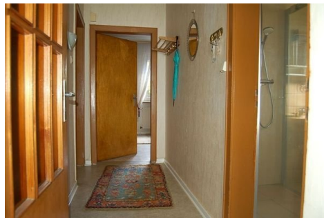
09 Flur EG.JPG