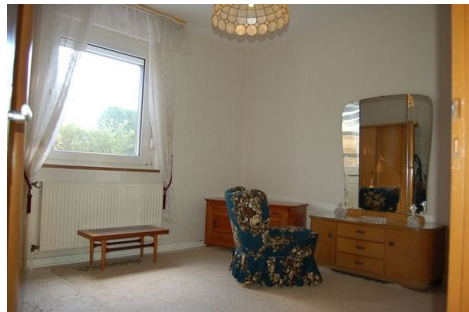
11 Zimmer EG.JPG