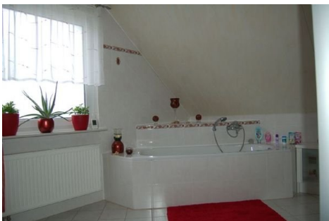
18 Bad mit Wanne