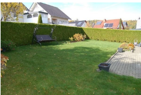
06 gepflegter Garten