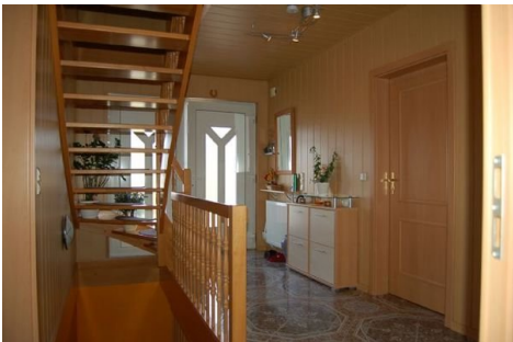
10 Flur Diele