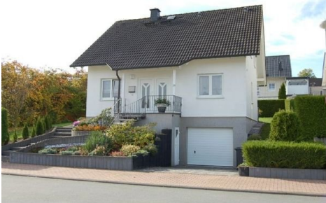
02 Gesamtansicht mit Garage