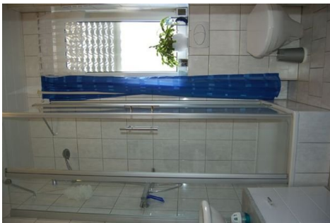
14 Gäste-WC mit Dusche