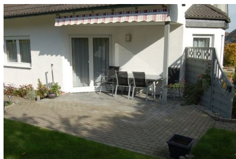
07 sonnige Terrasse