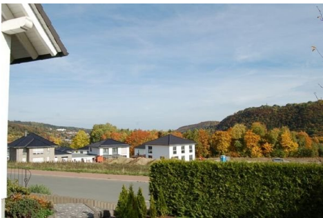
08 Ausblick Fernblick